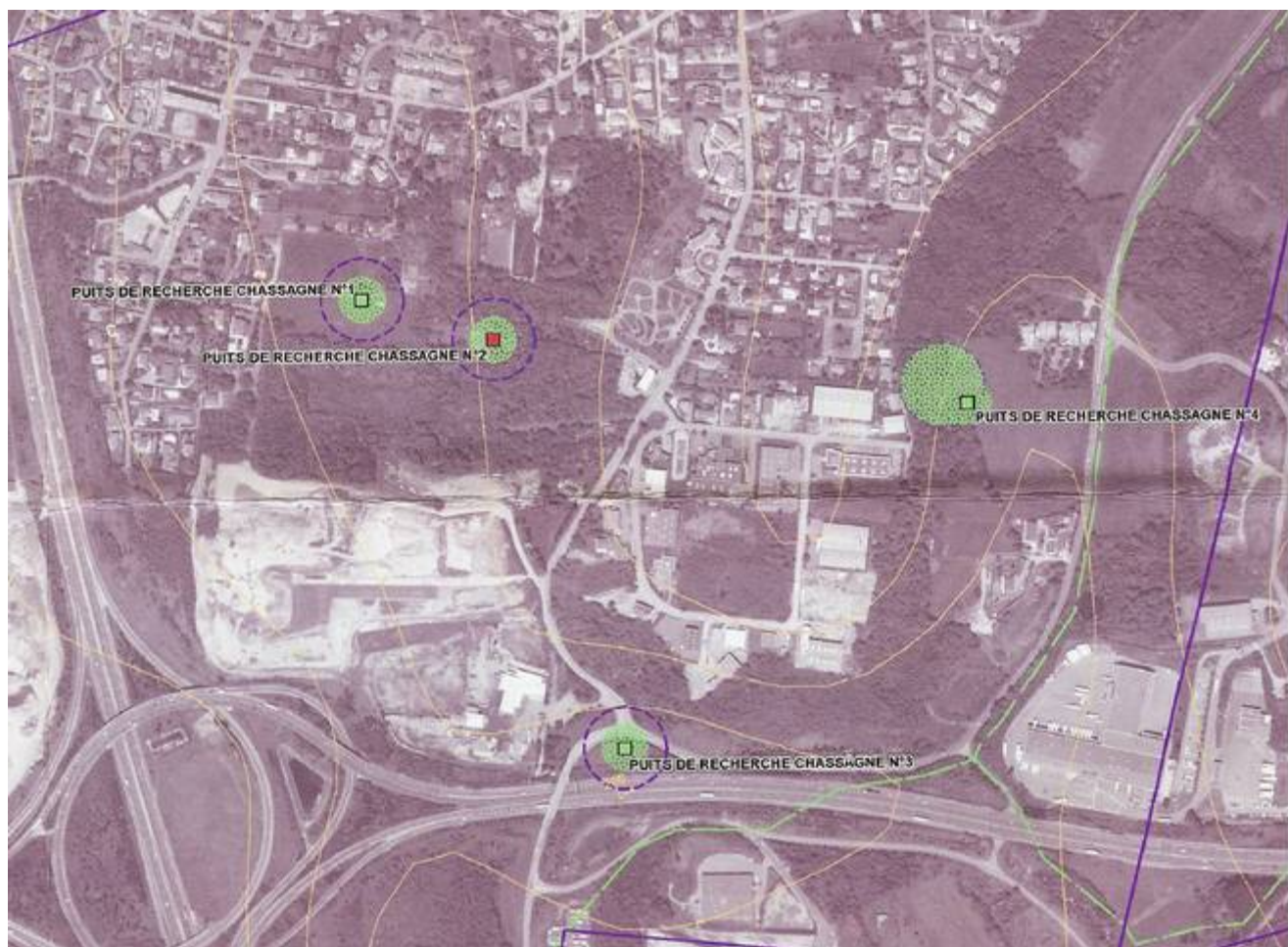
Extrait de la carte 1b : Carte d'aléa d'effondrement localisé – INRIS /GEODERIS

Par une étude détaillée communiquée à la collectivité le 24 septembre 2012, 4 puits de recherche ont été localisés sur le secteur Chassagne.